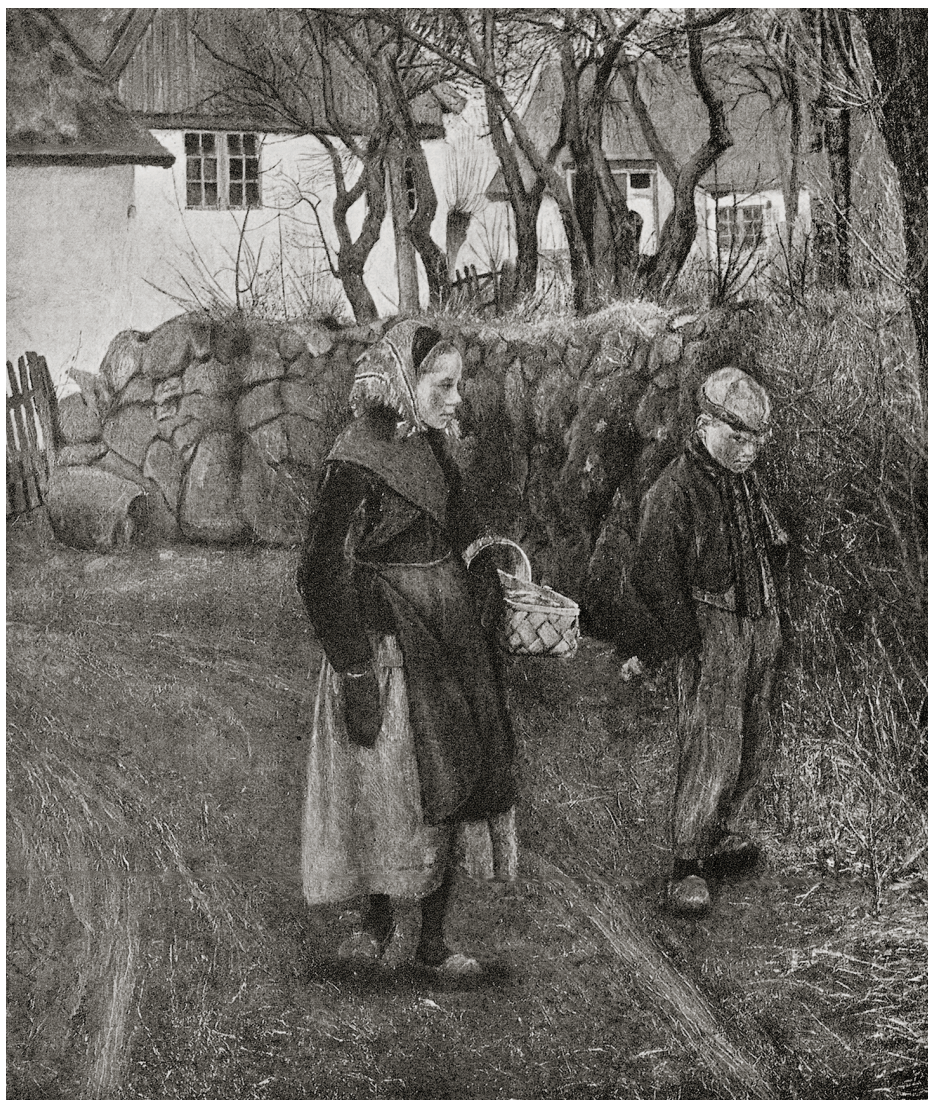
Figur 1.5: L.A. Ring, Tiggerbørn uden for en bondegaard i landsbyen Ring (1883). 94 x 77 cm. Privateje.

forsøgte i 1877 at spænde ben for Estrup ved at nægte at godkende regeringens forslag til finanslov for 1877-78. Det fik dog ikke Estrup til at kapitulere. Han regerede blot videre ved at udstede en provisorisk finanslov, noget som forfatningen tillod i "særdeles paatrængende Tilfælde". 12 I 1877 var harmen stor over det, Venstres sympatisører opfattede som klart forfatningsstridigt. Det skulle dog blive endnu værre i 1880'erne, efter at Venstre i 1881 havde indledt den såkaldte visnepolitik. Den betød reelt, at Folketingets flertal stemte nej til næsten alle de udgiftskrævende love, regeringen fremsatte. Regeringen gik bare ikke af, men fortsatte ufortrødent. Herved blev der sparet mange penge op i statskassen. Det fik i 1885 Estrup-regeringen til at tage et farligt skridt