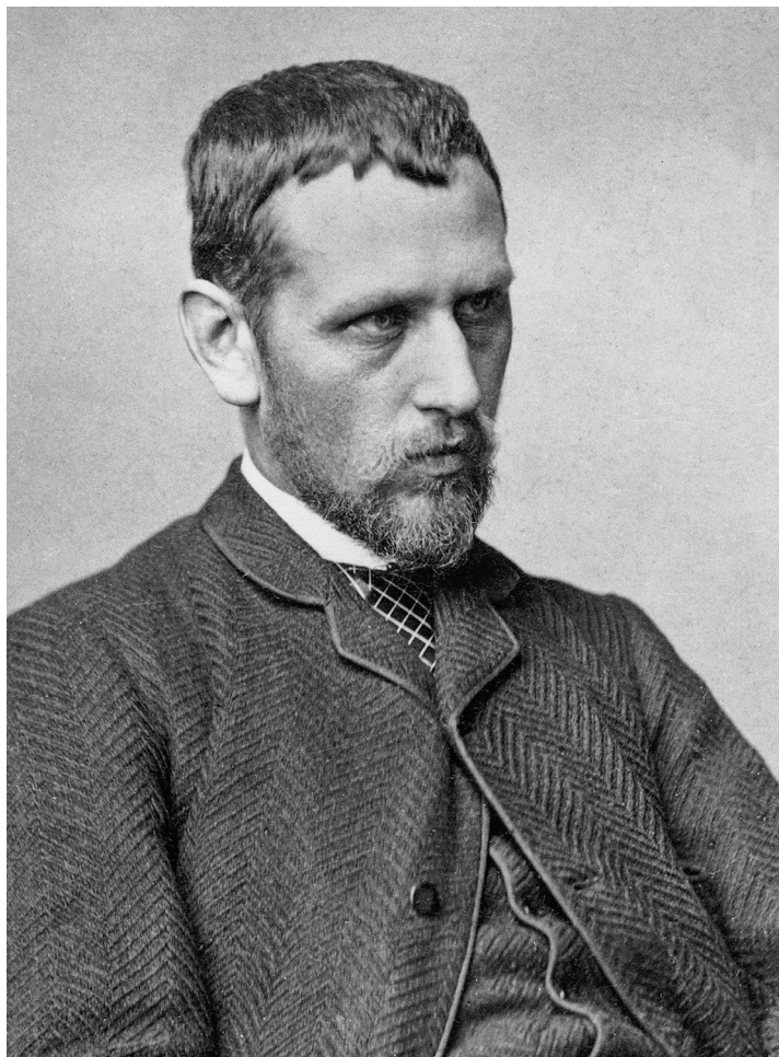
Figur 1.1: Fotografi af L.A. Ring fra 1888.