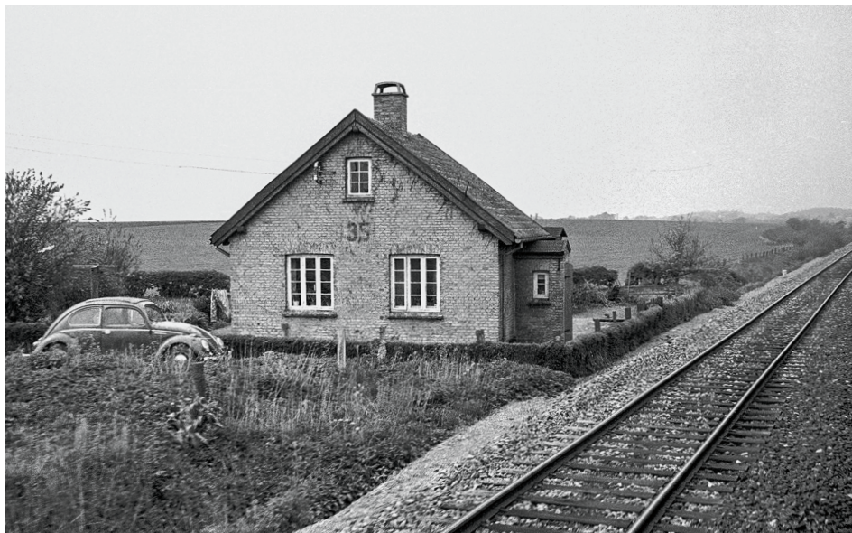
Figur 1.9: Banevogterhus nr. 35 i Sværdborg få kilometer syd for Ring. Huset, der er forsynet med en lille knast – et såkaldt skilderhus – i facaden ud mod jernbanen, er af den type, der blev bygget mange af i forbindelse med anlægget af Sydbanen i 1868-70. Huset havde en kvadratisk grundplan og vinduer i gavlen. Det bestod af forstue, køkken og to værelser, og det indvendige beboelsesareal var kun ca. 34 m 2. Banevogterhuset i Ring, der i hvert fald i 1890 havde nummeret 33, har været næsten identisk med det i Sværdborg.