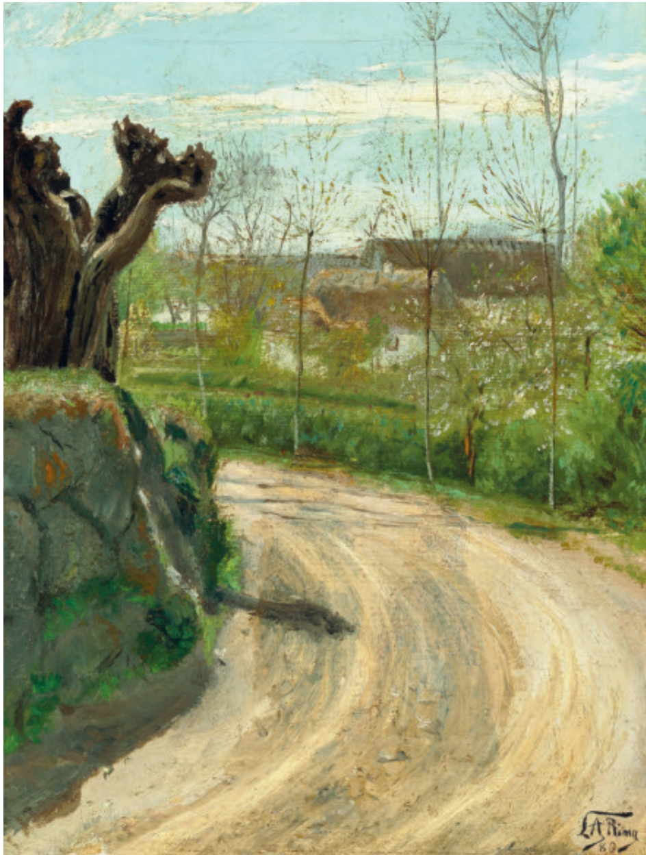
Figur 1.3: L.A. Ring, Vejen forbi morfaderens hus, L.A. Rings barndomshjem i landsbyen Ring. Forår (1880/82). Olie på lærred. 34 x 26 cm. Privateje.

forberede sig til Kunstakademiet, en aktivitet han finansierede ved at arbejde som håndværksmaler i sommerhalvåret. I januar 1875 blev han optaget på Kunstakademiets Forberedelsesskole, hvor han fulgte professor Frederik Vermehrens undervisning gennem flere semestre, inden han efter at have aftjent sin værnepligt gik videre i Modelskolen i 1877. Utilfredshed med undervisningen, der begge steder ”var fuld af dogmatiske Regler og smaalige Anvisninger”, 10 og en elendig økonomi