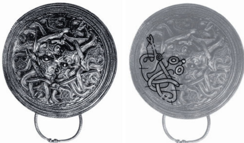
Fig. 2.1. Sølvspænde fra 2. halvdel af 900-årene. Diameter 6,2 cm. Fundet på Nonnebakken i Odense. Et af de komplicerede dyr, som indgår i ornamentikken, er udtegnet til højre med forklaring af anatomen, men dyrenes betydning er uvis. Spændets funktion var formentlig at lukke en kappe. Ringen nederst var til at fæstne noget i.

Skrevne tekster fik som nævnt en stadig vigtigere rolle. Det er nu, vi rigtig begynder at få navne på personer, viden om begivenheder, og samtidens eller den nærmere eftertids forklaringer på årsagssammenhænge. Udviklingen var langt fra slut ved år 1200, men mange skriftlige genrer var nu i brug i Danmark, og teksterne blev brugt både religiøst, administrativt, politisk-historisk og på andre måder. Hele denne skriftkultur blev introduceret fra udlandet: Tyskland, England og Frankrig, hvor den havde meget gamle rødder, og hovedsagelig af udenlandske gejstlige. Siden tog danske lærde over. I modsætning til bl.a. Island og til dels Norge