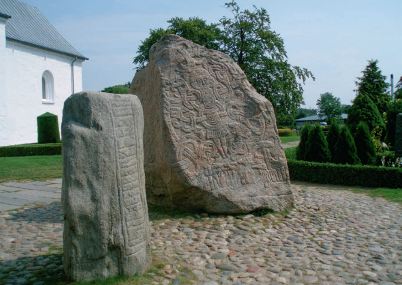
Fig. 1.2. Jellings to kongelige runesten. Den lille sten er rejst omkring år 950 af kong Gorm til minde om hans dronning Thyre. Den store er rejst omkring år 970 af Harald Blåtand til minde om forældrene og hans egne bedrifter, som bl.a. omfattede kristendommens officielle indførelse i Danmark. Fra kong Gorm kan den danske kongerække følges ubrudt til vor tid. Fotografiet er fra 2009, før stenene blev beskyttet af et glashus.

nogle, hvor jeg ikke deler alle synspunkter, eller hvor noget er forældet. Noterne er med til at orientere herom. Jeg bruger også den gængse betegnelse vikingetid for tidsrummet ca. 800-1050. Der er mange gode grunde til at bibeholde det indarbejdede og internationale navn, selv om nogle fra tid til anden mener, at det bør afskaffes. 2