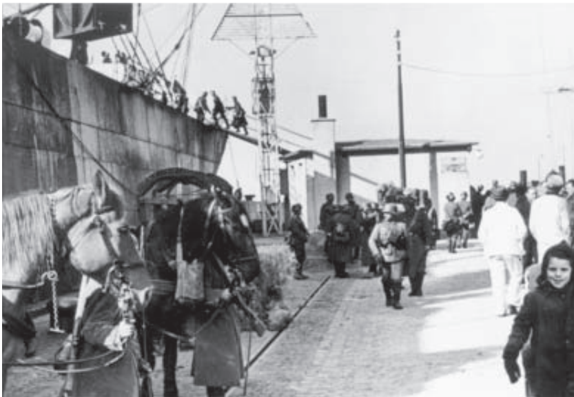
Landsætningen i København spillede kun en sekundær rolle i angrebet på Sjælland og Lolland-Falster. Hovedhavnene var Gedser og, som vist på billedet, Korsør. Begge steder fandt landgangen sted uden dansk modstand.

Angrebet blev ført over grænsen og ved landgang flere steder på øerne, i Gedser, Korsør, Nyborg og Assens. Særligt beskæmmende kom det til at virke, at et tysk skib uhindret landsatte en bataljon på Langelinjekajen i København, overrumplede garnisonen i Kastellet og var i ildkamp med garden ved Amalienborg, da et i hast sammenkaldt statsråd vedtog at opgive modstanden. Fra Middelgrundsfortet var det blevet forsøgt at skyde varselsskud