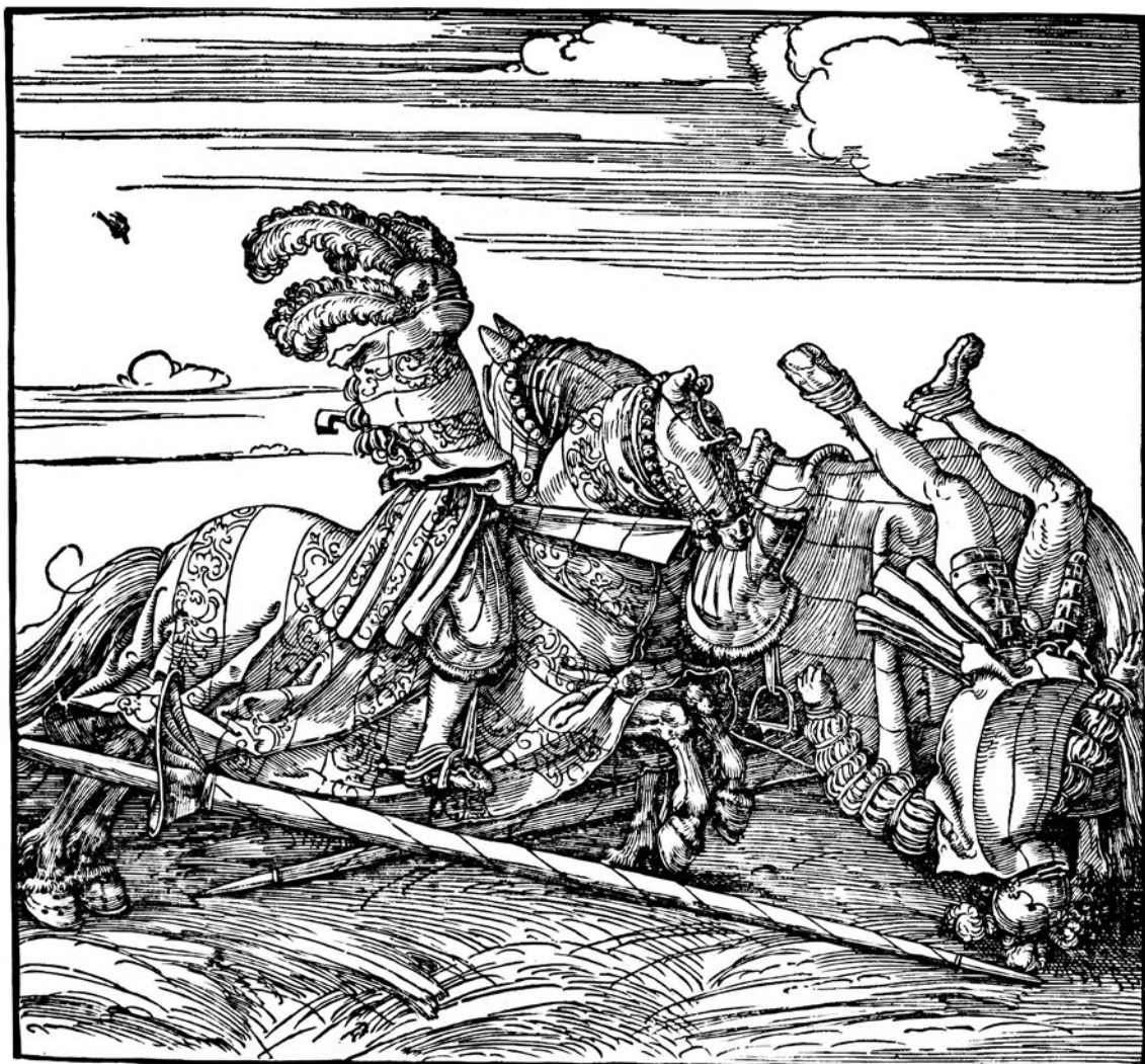
Albrecht Dürers træsnit med drivende, dystre skyer er fra omkring 1517 og viser, hvor dramatisk og farligt dystridt kunne være. Det er fra en hyldestbog til den turneringsglade tysk-romerske kejser Maximilian 1. Dürer blev det nye europæiske træsnits superstjerne, der hævede mediet fra bogillustration til selvstændig kunst.

1517 har vi for det danske rige registreret tre ridders død i turnering, og der kan have været flere. 3