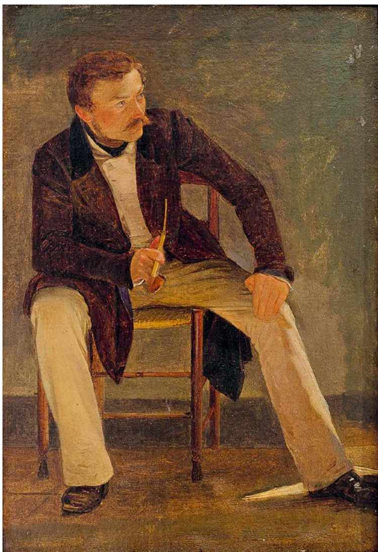
Constantin Hansen, Et selskab af danske kunstnere i Rom , 1837.